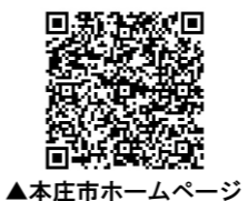
▲本庄市ホームページ