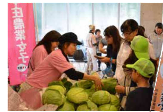
「本庄農業女子」ブースでは、色とりどりの新鮮野菜や花などを多くの方が買い求めていた

10月21日に、食と農のフェスティバル2017が本庄早稲田国際リサーチパークで開催されました。当日はあいにくの雨天となり、主に屋内でのイベント実施となりましたが、多くの方が来場し、生産者から自慢の食材の説明を受け買い求めたり、食育体験としてペットボトルピザを楽しそうに作ったりするなどして、大人も子どもも「食」を楽しんでいました。