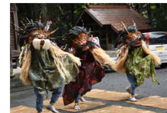
五穀豊穡の感謝を込めて3頭の獅子が舞う

10月17日に児玉町小平の石神神社で例大祭が行われ、獅子舞が奉納されました。江戸時代から続くこの獅子舞は小平獅子舞と呼ばれ、春は日本神社、秋は石神神社に奉納されます。当日は秋平さくら保育園で園児たちに獅子舞を披露し、その後石神神社へ。去年は雨のため石神神社で獅子舞を舞うことができませんでしたが、2年ぶりに石神神社で獅子舞が披露されました。