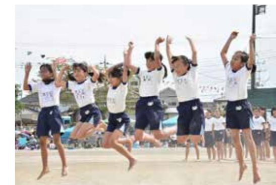
組体操の後、各班は思い思いのポーズを決める。この班は、ジャンプで感謝の気持ちを表現した

市内の各小学校で、9月16日・30日に開催された運動会。写真は児玉小運動会の様子。児玉小では、「協力し全力魂ぶつけあい 思い出に残る 運動会」をスローガンに、リレー、綱引き、玉入れなどのさまざまな競技が行われました。種目「協働～One for all All for one～」では、5・6年生がそれぞれ力を合わせて美しい組体操を披露し、観客を湧かせました。