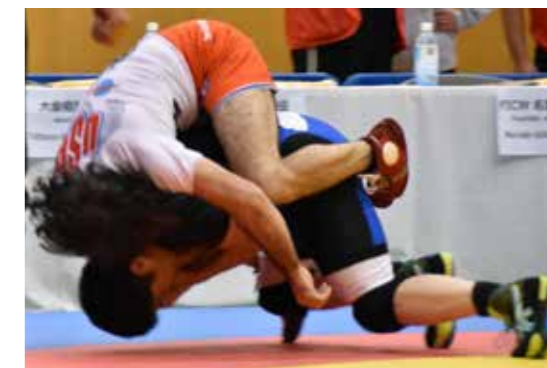
観ているだけで力が入ってしまうような、身体と身体のぶつかり合いは迫力満点

10月21日・22日の両日、シルクドームで開催された「第3回コンバットレスリング世界選手権大会」。組み、投げ、抑え、関節技や絞め技で「一本」をとるこの競技。本庄市初のスポーツの世界大会となったこの大会には、海外から多くの選手が集まり、2日間に渡り世界一の称号をかけて激しい闘いが繰り広げられました。コンバットレスリングを通して、国境を越えたスポーツの輪が広がっています。