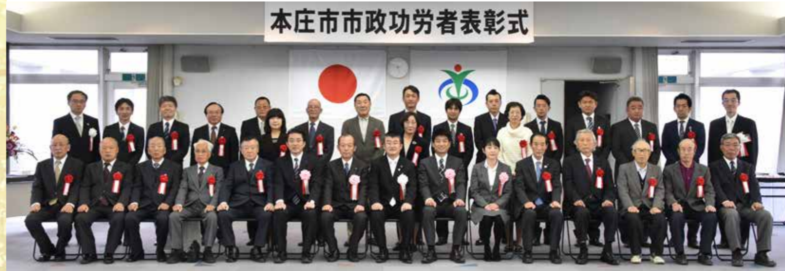
本庄市市政功労者表彰式