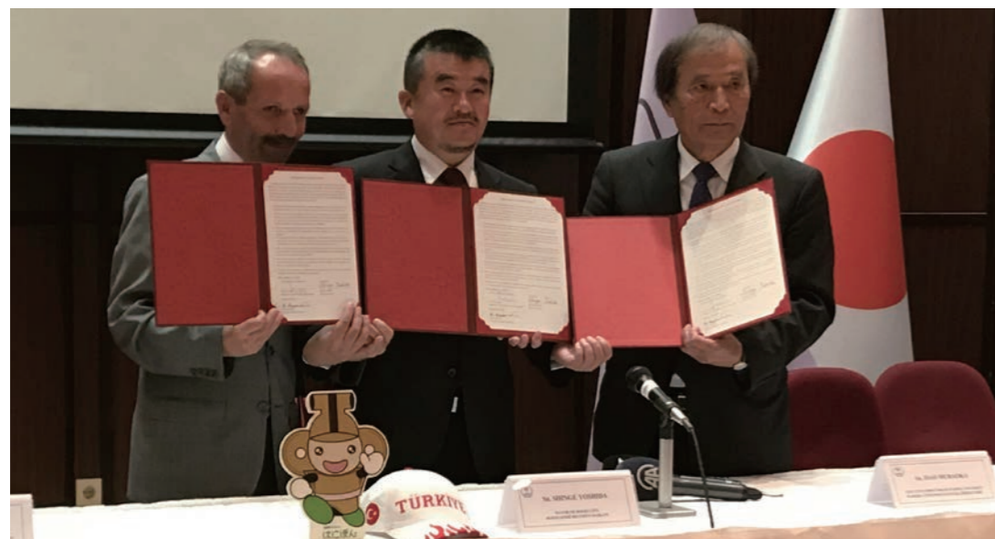
▲トルコ共和国アンカラ市にて覚書を締結

本庄市と早稲田大学、トルコ視覚障害者スポーツ協会は、10月4日、トルコ共和国のアンカラ市にて、東京2020パラリンピックでの5人制サッカートルコ代表チームが本庄市で事前キャンプを行う覚書を締結しました。