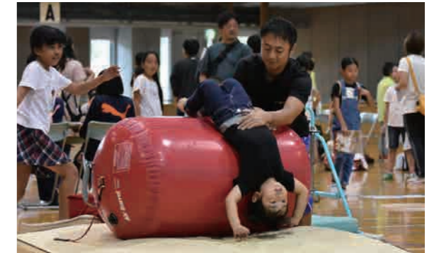
写真はエコーピアで実施された体創り運動体験コーナーの様子。なかなか体験できないスポーツも楽しんだ

10月8日、市内を4つのエリアに分けてさまざまなスポーツやレクリエーションを楽しむ「スポレクフェスタ2018」を開催しました。毎年体育の日に、「見る！する！楽しむ！」をテーマに行われているこのイベント。各会場には多くの体験コーナーが設けられ、それぞれ会場は大いに盛り上がりました。今年は市内外から約8,800人の参加があり、参加者はスポーツの秋を満喫していました。