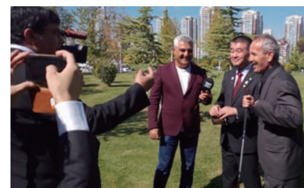
▲トルコ訪問をした様子が公営放送で報道された