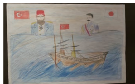
▲在トルコ日本国大使館に展示された友好の絵