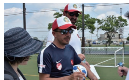
▲7月 トルコチーム関係者が来日し視察