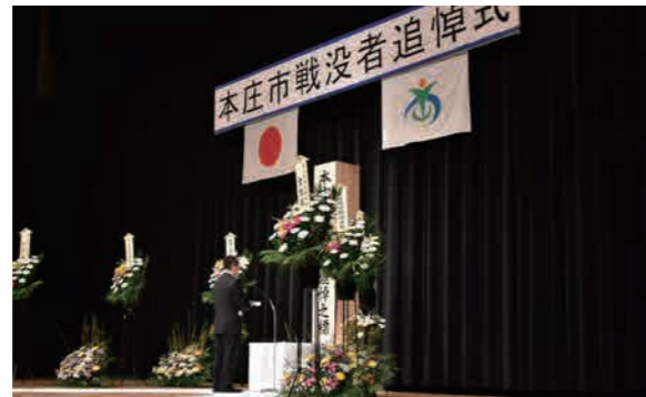
当日は約200名が訪れ、参加者 全員による献花が行われた

戦没者追悼式 哀悼と敬意の意をささげる 先日の戦争において亡く なられた市内出身1、 370余柱の冥福を祈る 戦没者追悼式が、10月18 日、市民文化会館で挙行 されました。 追悼式では、ご遺族を はじめ関係者による追悼 の辞、献花など戦没者に 哀悼と敬意の意をささ げ、恒久平和への祈念を 行いました。