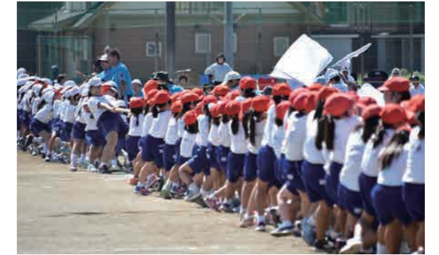
順延により平日の開催となったが、子どもたちの活躍を見ようと多くの保護者が訪れた

雨や接近する台風の影響で、日程の変更やプログラムの短縮などが行われた今年の運動会。日程が順延となり、10月2日に開催された北泉小学校の運動会では、快晴の空の下プログラム通りに実施し、徒競走や各学年ごとに行われる種目で赤白チームが得点を競い合いました。全学年の児童が参加した赤白対抗の綱引きでは、児童たちが長い列となり、力と力のぶつかり合いが繰り広げられました。