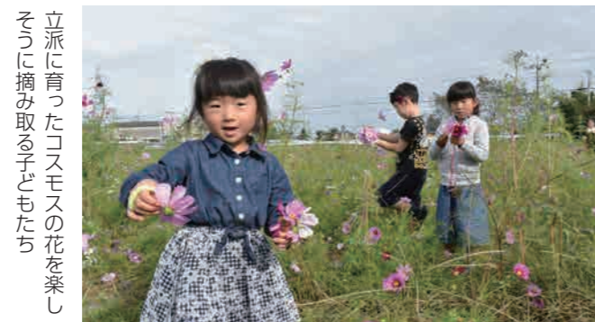
立派に育ったコスモスの花を楽し そうに摘み取る子どもたち