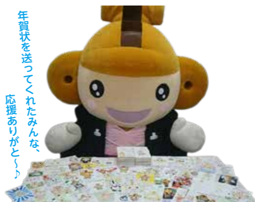
年賀状を送ってくれたみんな、応援ありがとうございました。

はにぼんも、「今年もみんなの声や願いをキャッチして、笑顔を届けられるように本庄市のPRを頑張るよお〜!」と、今年の意気込みを語っていました。