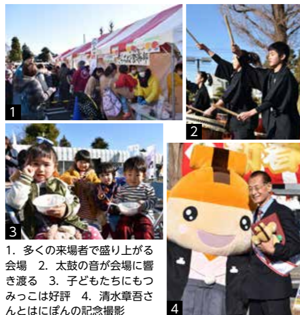
1. 多くの来場者で盛り上がる会場 2. 太鼓の音が会場に響き渡る 3. 子どもたちにもつみっこは好評 4. 清水章吾さんとはにぼんの記念撮影

今回、つみっこ合戦の開会セレモニーで、俳優の清水章吾さんの『本庄市広報観光大使及び文化・芸術アンバサダー就任式』が行われました。清水さんは「本庄市にはたくさんの宝があります。地元の方たちの人懐っこさもこの地域の宝の一つ。広報観光大使としてもっと本庄市を宣伝していきます」と、今後の活動への抱負を語ってくれました。