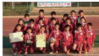
F. C グラウクス

県内約380チームがエントリーした「第2回スクール21カップ埼玉県スポーツ少年団U-10サッカー大会」。