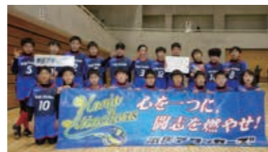
本庄アタッカーズ

第27回春の全国小学校ドッジボール選手権埼玉県大会で、スピードのあるパス回しからの鋭い投球による高い攻撃力を武器に準優勝となり、3月に開催される関東大会への出場権を獲得しました。