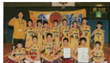
本庄ミニバスケットボール

地区予選を勝ち抜いた30チームで争われた「第48回埼玉県ミニバスケットボール大会」。