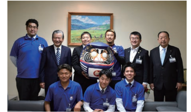
川淵三郎相談役を交えて記念撮影。この後、日本代表の必勝を願い、だるまの目入れを行った

5月11日、市長と児玉商工会青年部のみなさんが(公財)日本サッカー協会を訪問し、2018FIFAワールドカップロシア大会に出場する日本代表チームの必勝を期して、日本神社の「必勝だるま」を日本サッカー協会に贈呈しました。この「必勝だるま」は、なでしこJAPANが優勝したドイツワールドカップの際や、東京五輪誘致の際にも贈られた縁起物です。日本代表チームの活躍を期待しましょう。