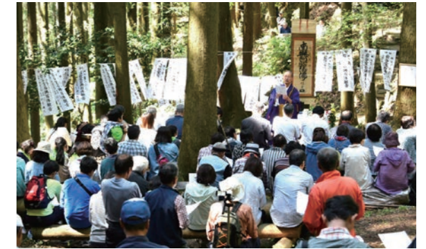
心願成就の祈願旗に囲まれ、住職の法話に耳を傾ける参加者たち

5月5日、児玉町小平の岩谷堂で岩谷堂まつりが開催。岩谷堂は山岳宗教の聖地でもあり、森林に囲まれた山深いところに位置し、洞窟や石仏群もあるなど、厳かな雰囲気になっています。当日は約90名の参加者が集まり、お経の読みあげや、祈願旗を奉納し、心願成就を祈願しました。岩谷堂保存会の方は、「ここは大自然に囲まれたパワースポット。エネルギーを十分持ち帰ってほしい」と話しました。