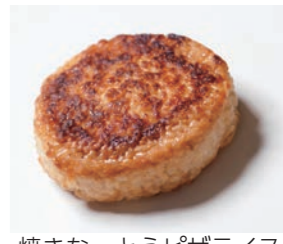
焼きなっとうピザライス

昨年7月、「地域を象徴する本庄児玉郡市のブランドを決めよう」をコンセプトに、こだま青年会議所が開催した「こだまめしグランプリ 2017」で、焼きなっとうピザライスは初代グランプリに輝き、本庄児玉郡市を代表するグルメに。