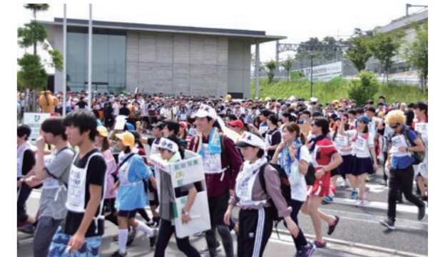
スタート直後の学生たち。約100kmの道のりは厳しく、たどり着くころには足に大きなマメができるそう

5月12日・13日の2日間をかけて、本庄市から約100キロ先、新宿区の早稲田大学を目指す、第56回本庄～早稲田100キロハイクが開催されました。今年は埼玉ひびきの農業協同組合本店をスタート地点とし、多くの学生たちが思い思いの仮装をして歩き出しました。通り沿いの家からは、学生たちの列に向かって子どもたちが声援を送る姿も見られ、道行く人を楽しませてくれました。