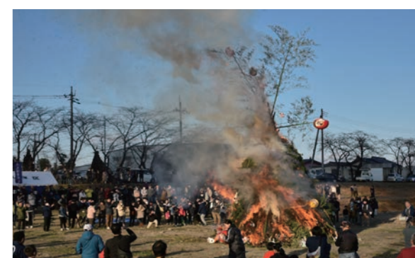
やぐらが勢いよく燃え上がり、竹の「どんどん」と弾ける音が会場に響き渡った

やぐらに点火されると、勢いよく燃え上がりました。また、この火で餅などを焼いて食べると御利益があると言われ、来場者は、まゆ玉(団子)を焼いて無病息災などを願いました。