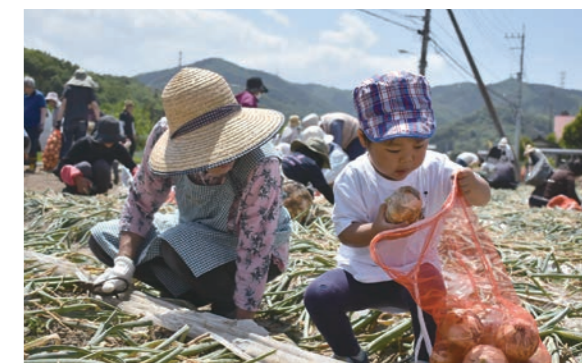
みずみずしく甘さが際立つ新たまねぎを、協力して収穫！

農業体験イベントの児玉たまねぎ収穫祭 in 小平が5月19 日に行われました。新たまねぎのおいしさを知ってもらい、 本庄産の野菜の魅力を感じてもらおうと企画された収穫祭に は、市内外から68名が参加。参加者は収穫方法の説明を受 け、それぞれ収穫に採りかかりました。収穫後は新たまねぎ を使ったレシピの紹介やたまねぎ料理の試食も振る舞われ、 参加者は本庄産の野菜を堪能していました。