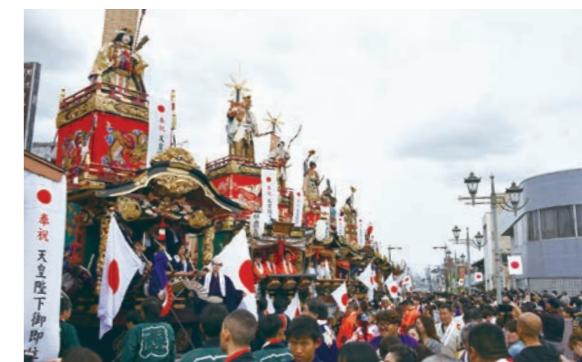
本駅前通りでは、本庄地域の山車10基が整列し、お囃子 の音色が響き渡った

本庄地域の絢爛豪華な山車10基によるお囃子と児玉地域 のみこし4基による勇壮なみこしの組み合わせが披露されまし た。これまでにない共演に集まった約1万人が本庄市の伝統 を楽しみました。