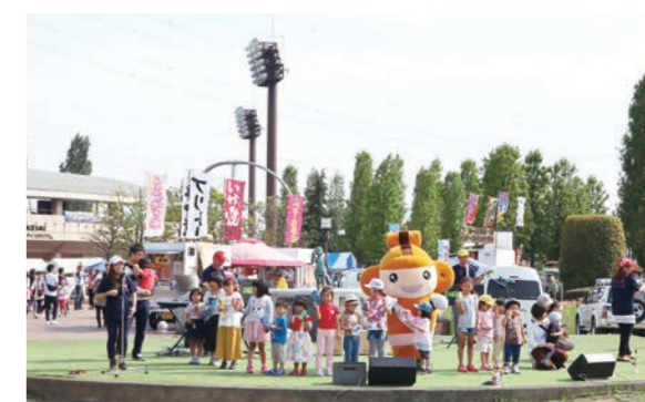
ステージイベントに多くの観客が集まり、パフォーマンス が終わるごとに大きな拍手が送られた

5月12日、本庄総合公園春まつりが行われました。今年で 13回目を迎えたまつりには、B級グルメや本庄名物の販売、 展示など90を超えるブースが並び、創作ダンスなどのステー ジ発表や猿回しも行われていました。来場者は2万3,000人 を数え、木陰でテントやシートを広げてくつろぎながら楽し む姿も見られ、思い思いに楽しい1日を過ごしていました。