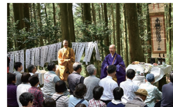
木漏れ日の中、住職の説法を聞く参加者

当日は約100名の参加者が集まり、祈願旗の奉納やお経の 読み上げなどが行われ、厳かな雰囲気にも包まれた岩谷堂で参 加者は心願成就を祈願しました。