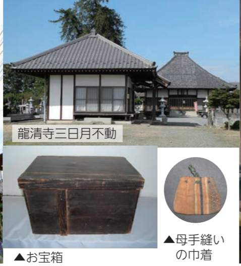
龍清寺三日月不動