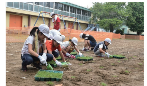
汗を流しながら、手際よく目印に沿って芝生苗を植え付ける

市では小学校の校庭の芝生化を進めており、藤田小学校で10校目となります。児童たちは、用意された約4,600株の芝生苗を手分けして一生懸命に校庭の外周と中庭に植え付けていました。