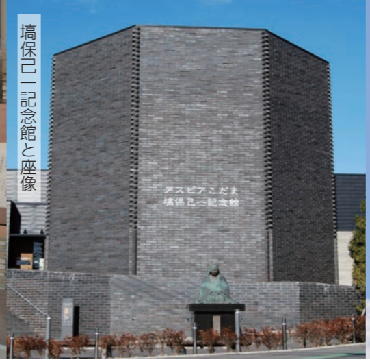
塙保己一記念館と座像