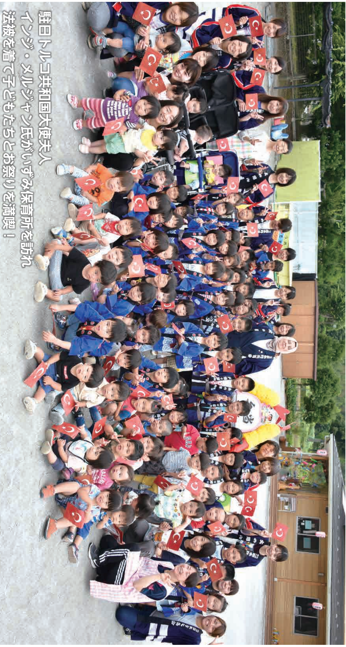
駐日トルコ共和国大使夫人 インジ・メルジジャン氏がいずみ保育所を訪れ 法被を着て子どもたちとお祭りを満喫！