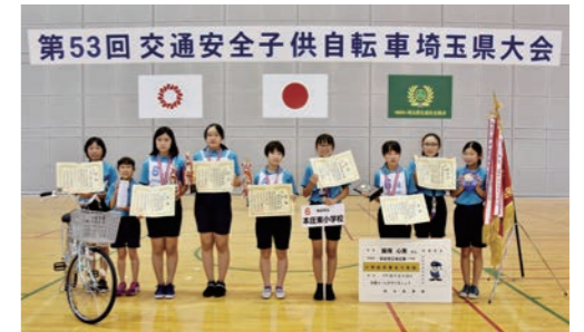
本庄東小学校選手