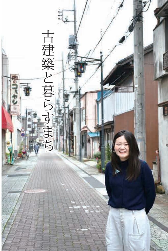
古建築と暮らすまち

「今後は、カメラを持って街歩きをしたり、ワークショップで空き店舗の改修を行ったり。そんな活動を通して、一緒にこのまちを楽しんでくれる人、本庄を好きな人が増えたら」と笑顔で語ってくれました。