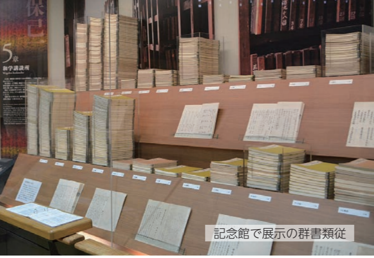
記念館で展示の群書類従