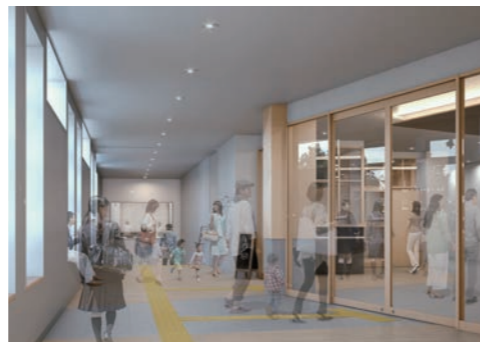
①完成イメージ 【エントランス】