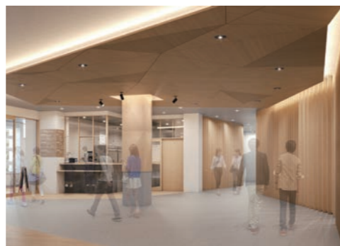
②完成イメージ 【広場、カフェ】