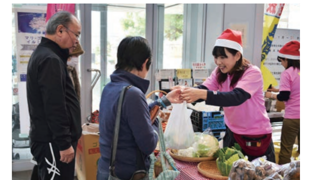
クリスマスにちなんでおそろいの帽子をかぶり野菜などを販売する本庄農業女子のみなさん

12月18日、本庄農業女子によるクリスマスマルシェが市役所市民ホールで開催されました。このマルシェは、地元産の野菜や花を身近に感じてほしいと企画され、昨年に続き2回目の開催となりました。訪れた人たちは、野菜のおいしい食べ方や、花の手入れ方法などを本庄農業女子のみなさんに教えてもらいながら買い物を楽しんでいました。