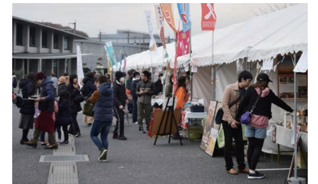
食事からデザートまで会場には本庄の「食」が集まった

本庄の「食」を通して本庄を知ってもらい、もっと好きになってもらおうと、12月7日にほんじょう食まつり～HONJO FOOD FESTIVAL～が開催されました。会場では、市内に店舗を持つ飲食店など20店舗が出店し、自慢のメニューを提供しました。また、武蔵青嵐太鼓や本庄南京玉すだれ会がパフォーマンスを披露し、会場を盛り上げました。