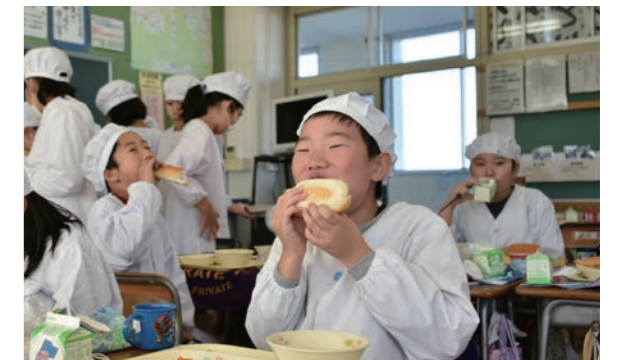
「サバサンドを食べるのは初めてだけどおいしい」と感想を話してくれた(金屋小学校)

本庄市がホストタウンとして交流を進めているトルコ共和国の文化を身近に感じてもらうと12月3日～5日、12日に市立小中学校の給食でトルコ料理「サバサンド」が提供されました。サバサンドはトルコのイスタンブール名物で、屋台などでも販売され、国民に親しまれている郷土料理の一つです。サバサンドを初めて食べる児童も多く、異国の食文化に興味を示していました。