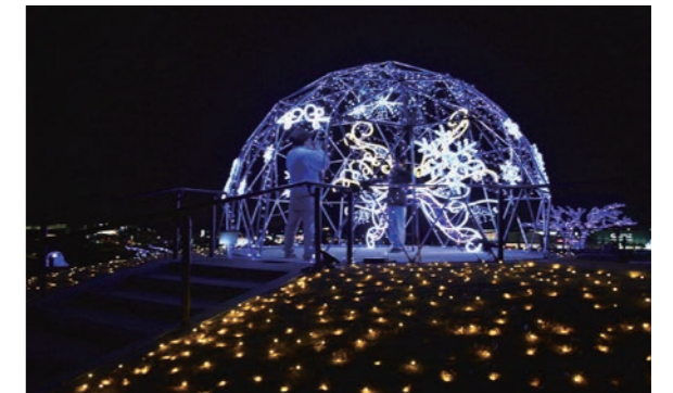
イルミネーションの点灯は午後5時～10時

本庄の冬を彩るマリーゴールドの丘イルミネーションが11月23日から点灯が始まりました。昨年人気だったドーム型イルミネーションは輝く羽の新装飾になり、さらに新たなオブジェなどでフォトスポットが増え、昨年よりも規模が格段にパワーアップしました。会場に訪れた人たちは写真や動画を撮り、冬の思い出を収めていました。