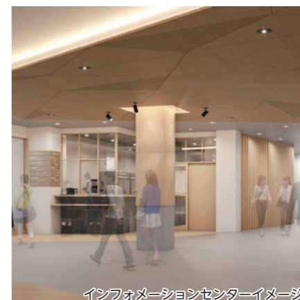
インフォメーションセンターイメージ