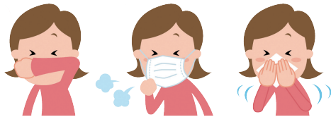
マスク着用・咳エチケット