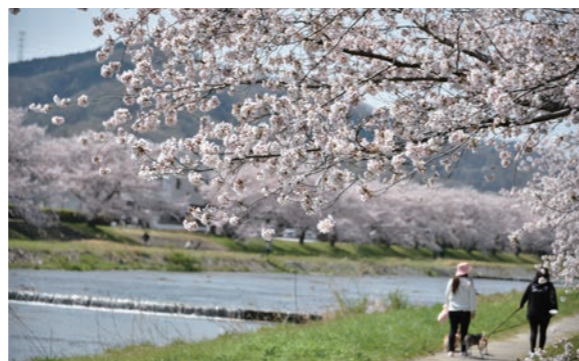
せせらぎの音もさわやかに…こども千本桜