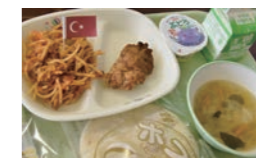
夫人と食べたケバブ