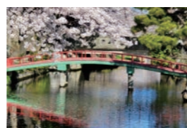
赤い橋に映える桜花