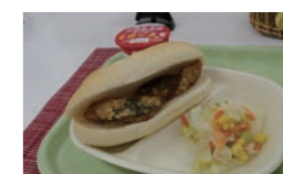
好評だったサバサンド