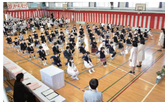
緊張の面持ちで…本庄南小学校入学式

本庄南小学校では、69名が新入学。新1年生は緊張しながらも、校長先生の言葉に真剣に耳を傾け、瞳を輝かせていました。