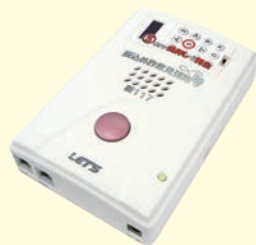
▲録音装置（実機写真）