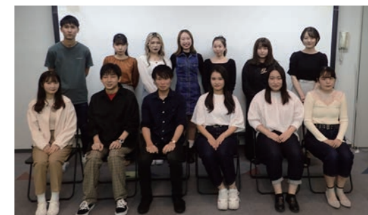
令和2年度 成人の祝い実行委員

令和2年度市議会第3回定例会が、8月26日から9月18日までの日程で開催されました。今議会には、予算総額を歳入歳出それぞれ387億1,556万8,000円とする「令和2年度本庄市一般会計補正予算(第10号)」、「市道路線の廃止について」、「市道路線の認定について」など10議案を提出し、さらに最終日に、令和元年度決算認定を含む9議案を提出しました。また、議員提出議案として「新型コロナウイルス感染症の影響に伴う地方財政の急激な悪化に対し地方税財源の確保を求める意見書」など4議案が提出されました。24日間の審議の結果、令和元年度決算認定の8議案が閉会中の継続審査とされ、それ以外の15議案は原案のとおり可決され、閉会しました。