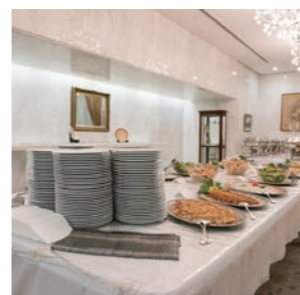
レセプションパーティーの準備

敷地内には中庭があり、大使公邸は床と壁がトルコ産の大理石で覆われています。全面ガラス張りになっているため、外からの光が大理石に反射し、室内を明るく照らしています。