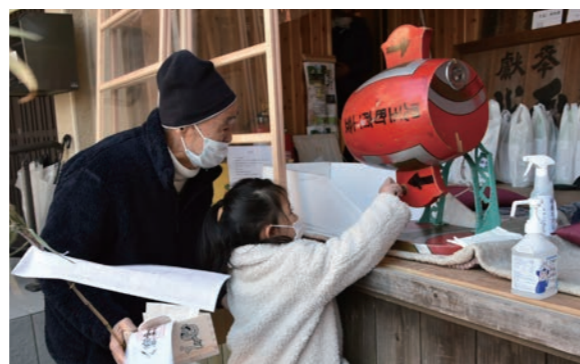
八幡神社では、福景品が当たる福引も行われた

八幡神社では、追儺祭と呼ばれ、年男(家主)が祈禱を受け、豆まきを行います。今年は一部内容を縮小し、2回に分けて追儺祭を行いました。神社を訪れた一般の参拝者は、お祓いを受けたのち福餅・お札・杓文字を受け、一年の無病息災を祈っていました。