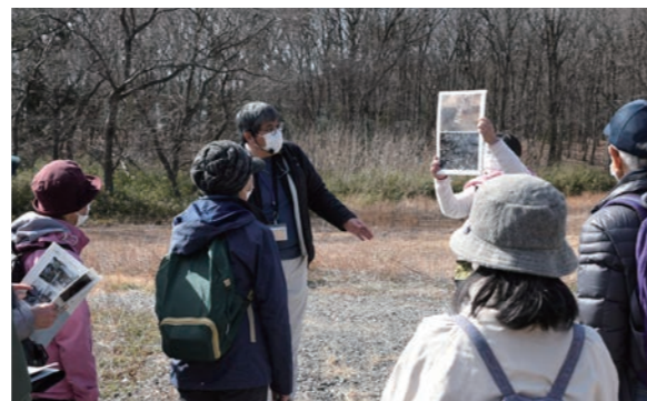
現在、雑木林となっている寺院跡では、発掘担当者が発掘調査の資料を交えて説明

2月10日、14日に徹底解剖! 学芸員・発掘担当者と巡る大久保山史跡探訪が開催されました。本庄早稲田の杜ミュージアムからスタートし、大久保山周辺の古墳や遺跡、史跡などを実際に歩いて巡りました。発掘調査の様子や研究成果について解説を聞き、参加者は、質問をしながら普段は見過ごしてしまっている風景の中にも歴史が息づいていることに思いを巡らせていました。