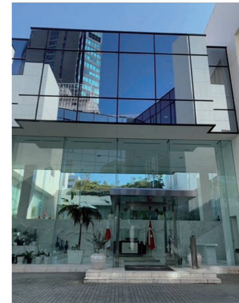
全面ガラスの大使公邸入口

大使館では約50人のスタッフが働いています。大使公邸では、会食やレセプションパーティーも行われています。