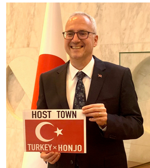
コルクット・ギュンゲン 駐日トルコ大使

7月より開催される東京2020オリンピック・パラリンピック競技大会では、多くのトルコ人選手が出場する予定となっております。パラテコンドー選手をはじめ、トルコ人選手を応援していただけると嬉しいです。