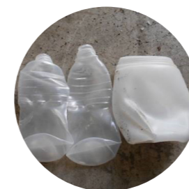
半透明のボトルは資源ごみには出せません

資源ごみとして出しているペットボトルは選別・粉碎などの工程を経て、作業着や卵のパックなどペットボトル以外の素材に生まれ変わります。適切な分別にご協力をお願いします。