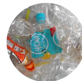
キャップとラベルは取り外しましょう