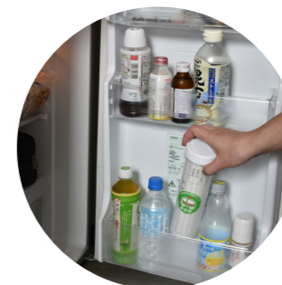
▲冷蔵庫で保管する