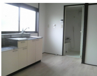
キッチンとバリアフリー化した浴室

※抽選の場合、結果は11月にお知らせします。 申込 9月27日(月)から10月8日(金)までに市営住宅入居申告書及び必要書類を営繕住宅課(市役所2階)または支所環境産業課(アスピアこだま2階)に提出 ※市営住宅入居申告書は提出先で配付。 ★営繕住宅課 ☎25・1141