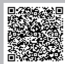
水道Q & A (市HP)

※濁水(赤水)の発生及び設備器具等(給湯器等)の影響については、市HPで確認、または水道課までお問い合わせください。