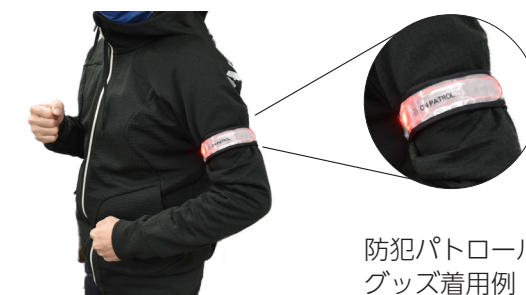
防犯パトロールグッズ着用例