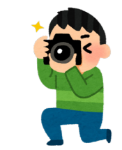
野鳥写真教室のイラスト

◆ゼロから始める英会話 中学校で学ぶ程度の英語で、あいさつ、質問の仕方、日常生活で自分の意思を伝える表現、外国で使える便利な表現など、基本的な会話表現を学びます。 日時 5月18日から6月8日までの毎週水曜日 全4回 午前10時～11時30分