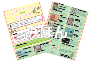
カタログ掲載イメージ