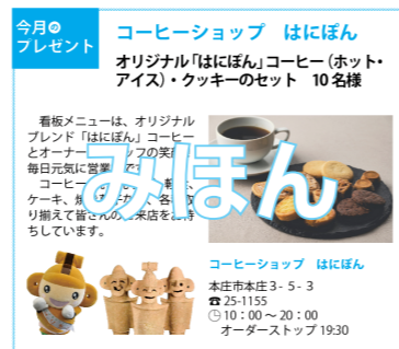
掲載イメージ（実際はカラー）

プレゼントを提供していただくことで、掲載料は無料で「広報ほんじょう」に店舗情報を掲載する企画です。毎月32,500部発行の広報ほんじょうでイチオシの商品をPRしませんか。