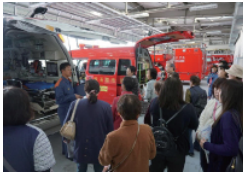
担当の施設説明を聞く先では、訪問先から詳しい説明を受けることができます