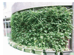
▲昨年市長賞を受賞したゴーヤと朝顔の緑のカーテン

※詳細は環境推進課(市役所4階)、環境産業課(アスパアこだま内)で配布する応募要領をご覧ください。市ホームページからもダウンロードできます。