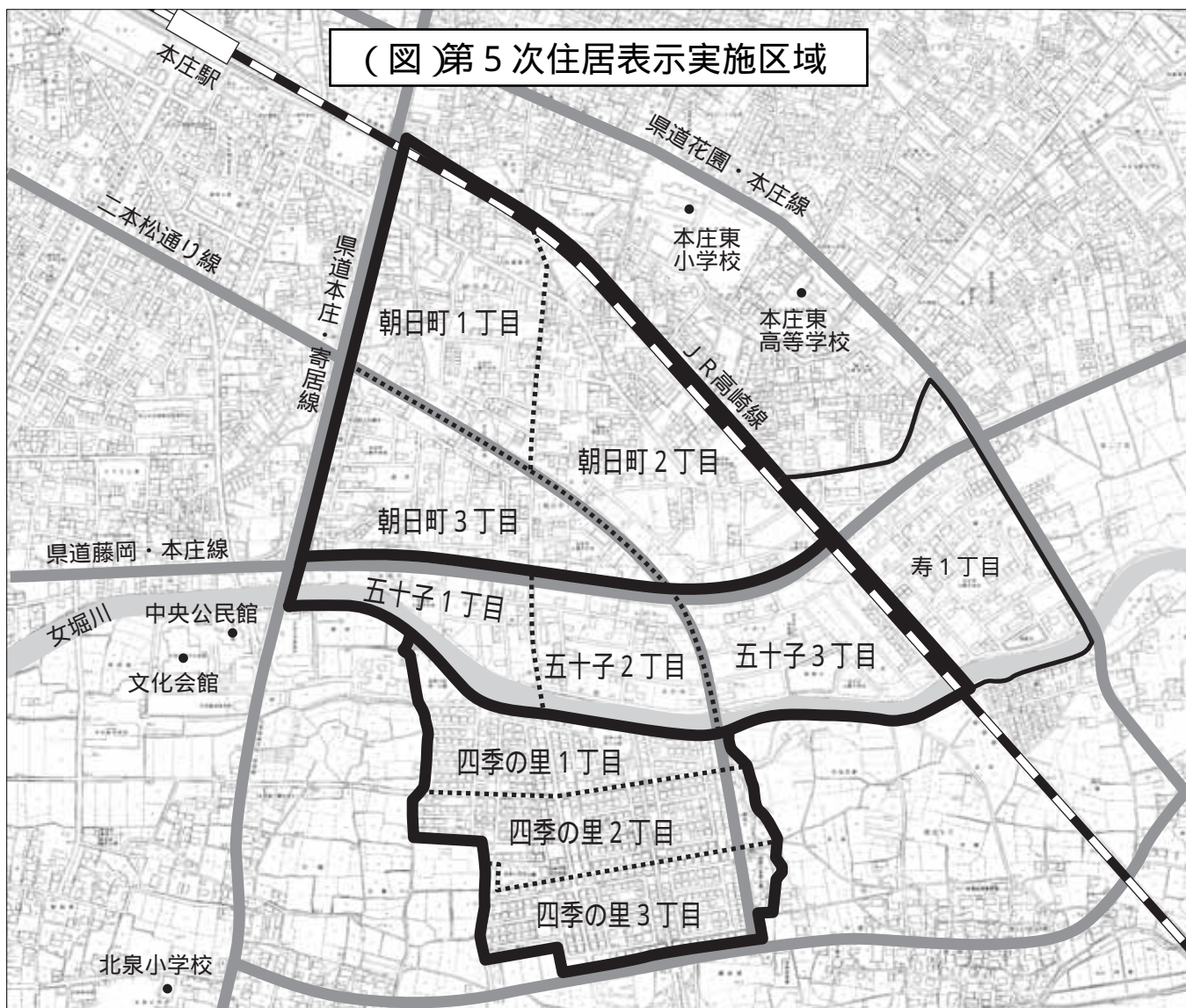
(図)第5次住居表示実施区域