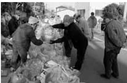
1/13虚空蔵尊例祭・だるま市(虚空蔵寺)