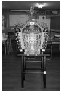
けやき自治会子供御輿

自治総合センターが実施している平成19年度宝くじ助成を受けて、市内では、けや木自治会が子供御輿を、秋山自治会が八木節衣装一式をそれぞれ購入しました。