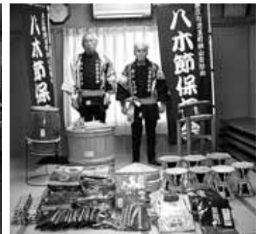
秋山自治会 八木節衣装一式