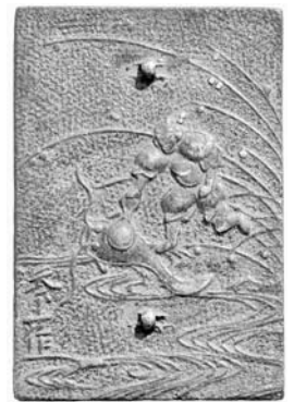
▲発掘された『松鶴鏡』(左)と『瓢鯨図』の鏡(右)

このほか、久下東遺跡からは多くの江戸時代の墓の跡が発見されています。ここからは、『蓬萊鏡』と呼ばれる青銅製の鏡と、