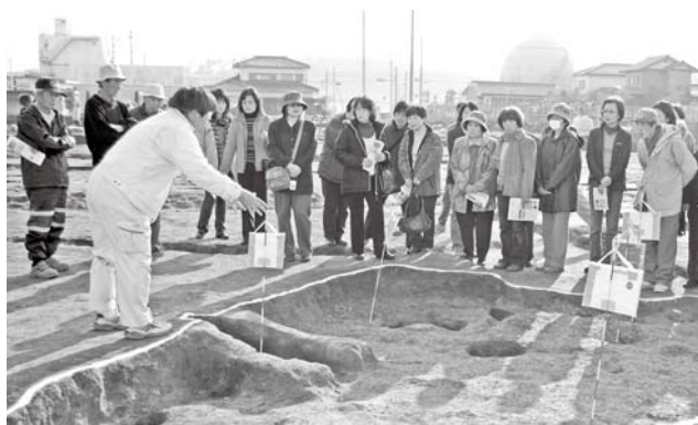
▲昨年12月に開催した発掘調査現地説明会の様子

このほか、久下東遺跡からは多くの江戸時代の墓の跡が発見されています。ここからは、『蓬萊鏡』と呼ばれる青銅製の鏡と、