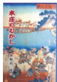
本庄のむかし 柴崎 起三雄 著