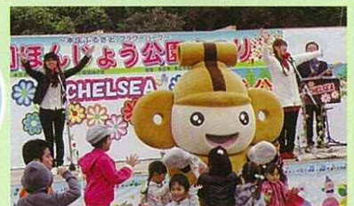
青春バンド チェルシー

本庄市マスコット「はにほん」です。会場で見つけたら声をかけてね。よいこのみなさんにプレゼントします。