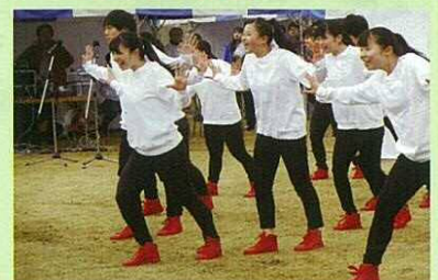
本庄第一高等学校ダンス部