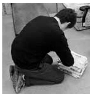
貴重な資源を大切に!

集団資源回収事業のしくみが、4月の申請分から次のとおり一部変わります。 市に登録した集団資源回収団体であれば、回収した資源ごみを有価物取扱登録業者