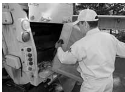
きちんと回収、きちんとリサイクル!

資源ごみを持ち出すことはできません。 資源ごみとは、再生利用することを目的に分別して排出されたびん類、缶類、ペットボトルをいいます。