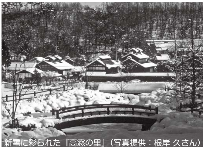
新雪に彩られた『高窓の里』

見玉町小平に『高窓の里』と呼ばれる地域があることをご存じですか。「高窓」というのは、かつての養蚕農家