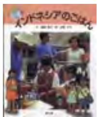
インドネシアのごはん 銀城康子文

かいぶつトルルのまほうのおしろ たなか鮎子作・絵 かいけつゾロリきょうふのよ ukaien 著