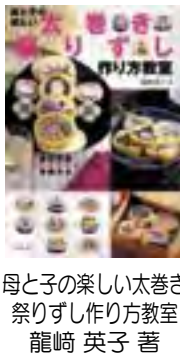
おかしな料理 龍崎英子著