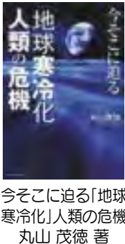
地球寒冷却化 人類の危機 丸山茂徳著