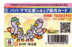
有効期限：平成28年3月末日

ため、新しいカードへの切り替えが必要です。群馬県から新しいカードが届きしだい、窓口で配布する予定です。（小中学校等での配布予定はありません。） ＊詳しくは左記へお問い合わせください。