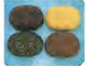
四色おはぎ (つぶ・こあん・ごま)

TEL.0495-22-2315 FAX.0495-22-2321 定休日：3/6(水)、13(水)、21(木)、27(水)