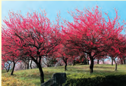
▲昨年3月の本庄総合公園の梅です。今年も今月が見頃でしょうか。