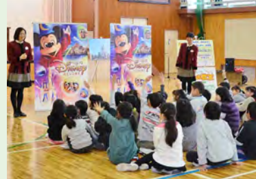
▲1年生から4年生が受講(藤田小)

授業の終了後には、キャストからたくさんのお話を学んだ証明として「修了証」が手渡されました。