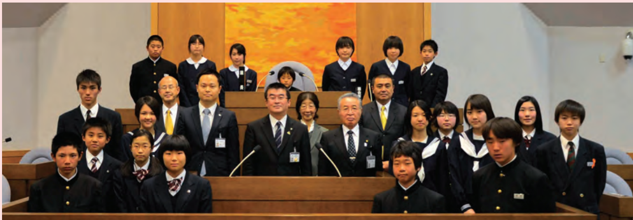
▲各中学校の代表として参加した議員全員が議場で発言しました。みなさんお疲れ様でした。