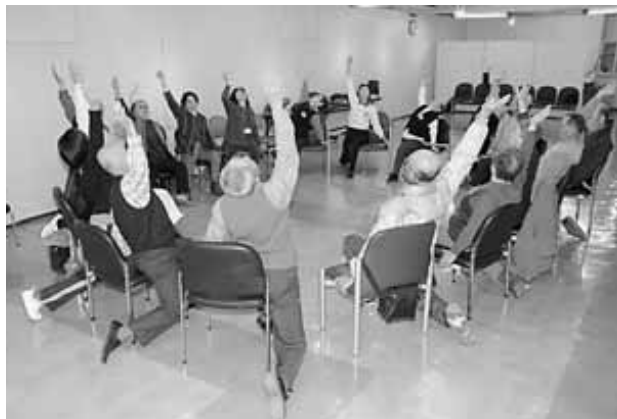
市民プラザでのようす