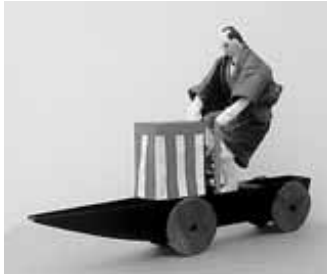
門弥式陸船車（模型）

滋賀県彦根市立図書館にある『平石家文書』に、「武州北堀村（今の本庄市北堀）の門弥なる人物が、一時に七里を走り（時速約14km）坂も登れる「陸船車」なる乗り物を作り、近々將軍がご覧になる。」という享保14（1729）年の記録が残っています。