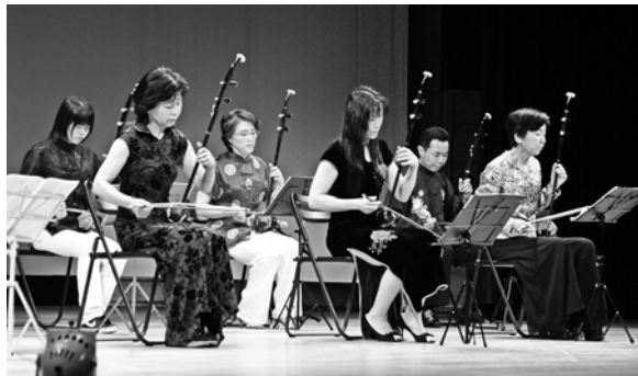
3 / 15 こだま芸術文化のつどい (セルディ)