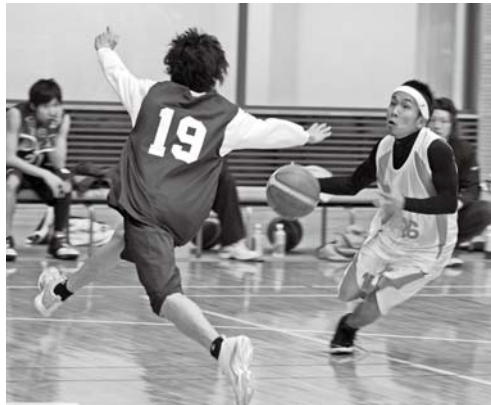
3/1市民バスケットボール大会 (シルクドーム)

生55人がビオトープ造り体験学習を行いました。当日は市職員の指導のもと、昨年子どもたちが発表した「魚の形をした島のデザイン」に沿ったビオトープを実際に造ってみました。