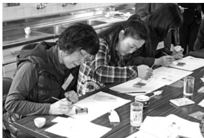
3 / 4 七宝焼体験教室 (旭公)