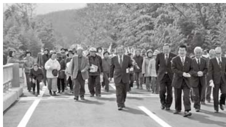
両地区を結ぶ千本桜橋の渡り初め

平成16年度から整備を進めていた小平・高柳間の農道が、3月13日開通しました。小山川に架かる千本桜橋により両地区間の交流が容易になります。