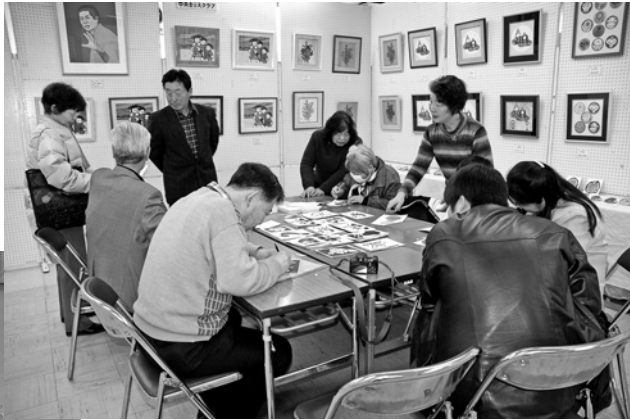
3 / 7・8 中央公民館クラブ活動発表会