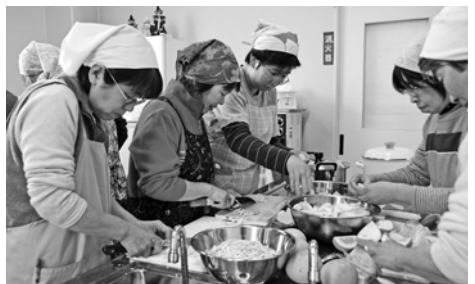
3 / 11 マーメイド作り教室(本庄東公)