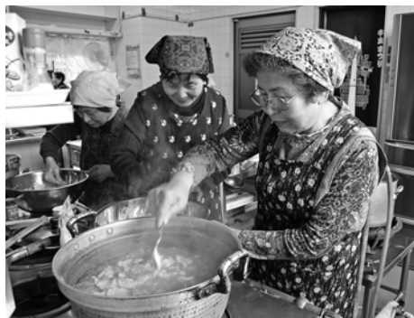
3 / 3 ママさんの「ニューつみっこ」 優勝者の料理教室 (つきみ荘)