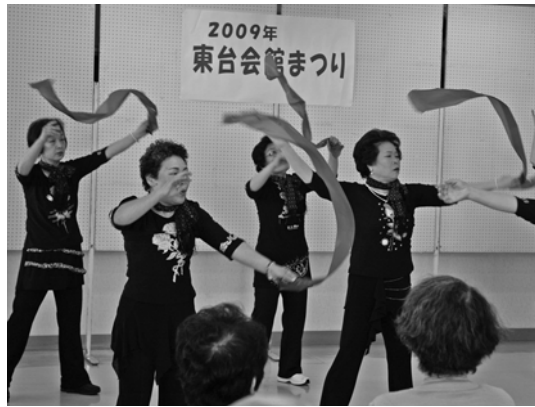
3 / 15 東台会館まつり