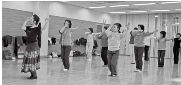
3/11癒しのフラダンス (シルクドーム)