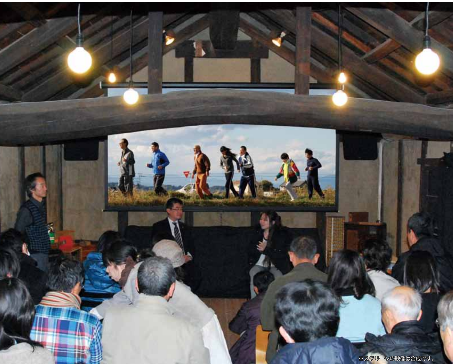
※スクリーンの映像は合成です。