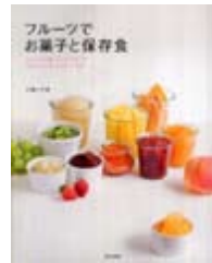
フルーツでお菓子と保存食 小嶋 いず美 著