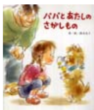
パパとあたしのさがしもの 鈴木 永子 作・絵