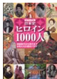
ビジュアル日本史 ヒロイン1000人 小田 哲男 監修