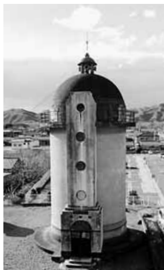
【国登録有形文化財】 児玉町旧配水塔

A 家の中の水道管全体に鉄さびが発生しているためです。家の中の水道管を取り替える必要があります。指定水道工事にご連絡ください。