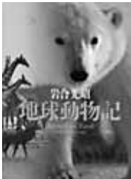
地球動物記 岩合光昭 著