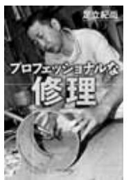
プロフェッショナルな修理 足立 紀尚 著