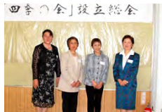
「四季の会」設立総会 「四季の会」役員のみなさん

「四季の会」では、地域農業への理解促進などを図るため、研修会や子どもたちの食育などの事業を行っていく予定です。