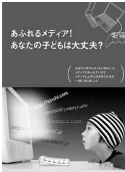
強調月間ポスター

そこで、県では毎年7月を「青少年の非行問題に取り組む特別強調月間」と定め、市町村をはじめ、関係団体・家庭・学校・地域の連携のもとに、青少年の健全育成を目指す運動を展開します。