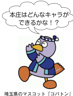
埼玉県のマスコット「コバトン」

※マスコットキャラクターの公募は、5月31日で締め切り、総数にして1,150件の応募がありました。