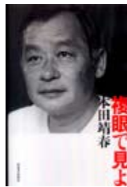
複眼で見よ 本田靖春 著