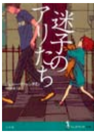
迷子のアリたち ジェニー・ヴァレンティン 著