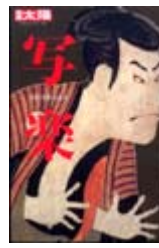
写 楽 秀剛 編 浅野 秀剛